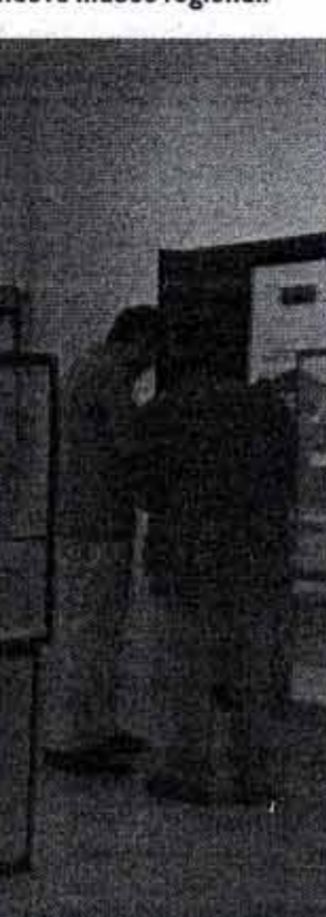
DIARIO DE LOS DINOSAURIOS/LUIS MENA

mo del CAS, que lleva más de 30 años excavando en la zona, la labor científica irá a más. La Fundación para el Estudio de los Dinosaurios de Castilla y León, que gestiona nuestro museo, promueve la divulgación de los hallazgos y de los estudios y ese también será uno de nuestros objetivos. Para mí, el atractivo de este proyecto es recuperar el patrimonio paleontológico, poner en valor los yacimientos, divulgarlos.