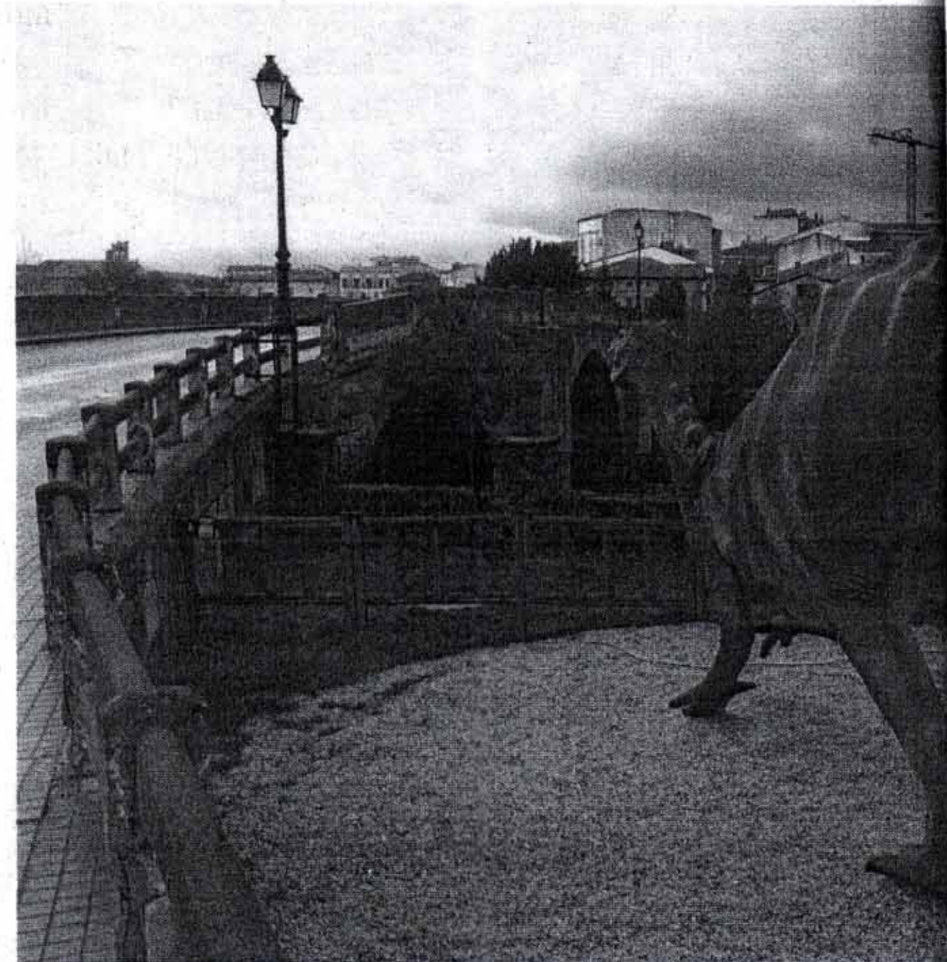
Un ejemplar de dinosaurio, a la entrada de Salas de los Infantes, sirve de reclamo del Museo de Dinosaurios de la ciudad.