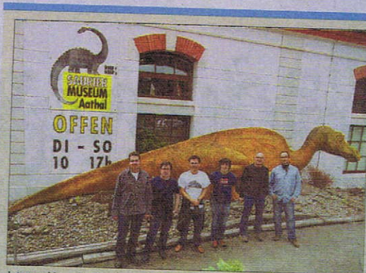
Intercambio realizado por miembros del CAS en Suiza en 2014.

de restos fósiles, en catalogar piezas descubiertas y en la creación del actual Museo de Dinosaurios. Una vez que este abrió sus puertas en 2001, comenzó a prepararse la primera excavación más en serio. Esta fue en el verano del 2002 en