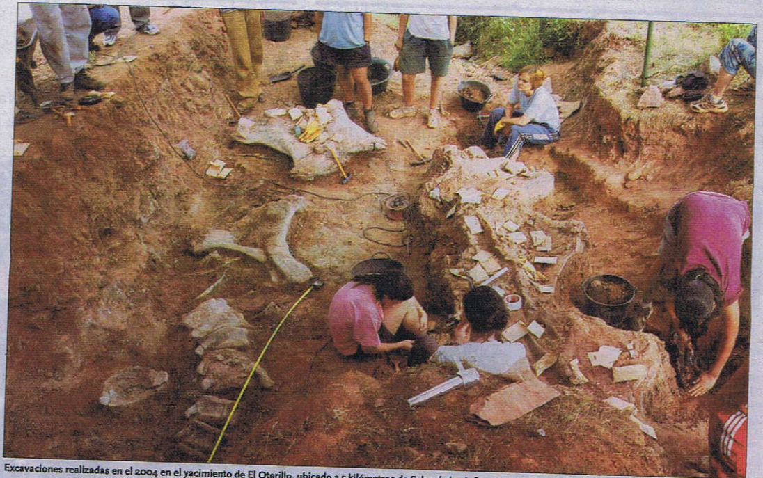
Excavaciones realizadas en el 2004 en el yacimiento de El Oterillo, ubicado a 5 kilómetros de Salas de los Infantes por la carretera que va a Barbadillo.