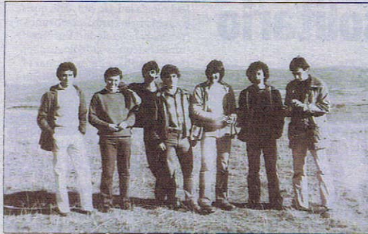
El grupo que formaba el colectivo salense en el año 1980.

«Defenderé temas importantes como el nuevo trazado de la N-1 y la no prórroga de la concesión de la AP-1»