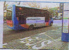
Coches en doble fila o aparcados en la parada dificultan el recorrido.